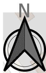
Схема сучасного використання території та схема існуючих обмежень у використанні земель М 1:1000